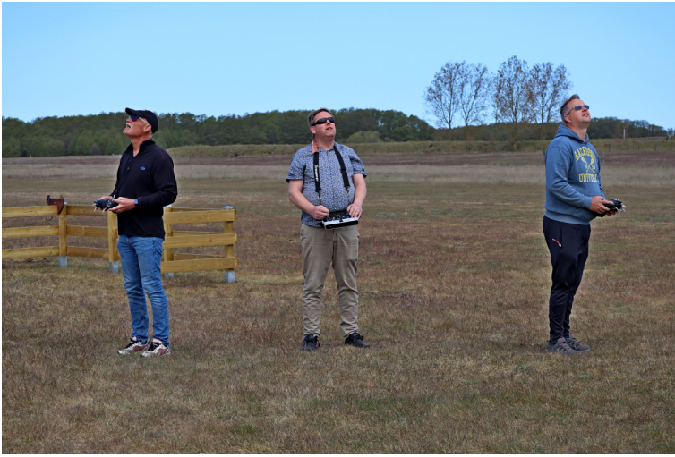
På spaning efter himmelsfärden kanske?

Snarare på termikjakt - men har ännu inte kommit i samma fas som våra danska termikjägare som vet att en vilstol är det enda rätta för långa mysiga flygningar.