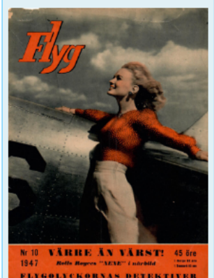
1947 nr 10