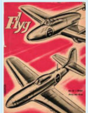
1945 nr 8