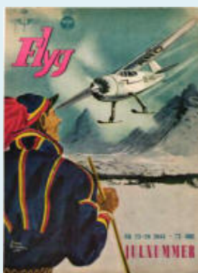
1944 nr 25/26