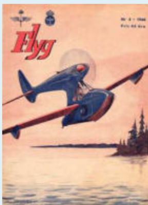
1944 nr 5