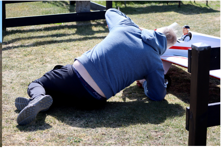
Den går för torr. Den går för fett. Men efter några dagars justeringar så gick den nästan perfekt.

Snarare på termikjakt - men har ännu inte kommit i samma fas som våra danska termikjägare som vet att en vilstol är det enda rätta för långa mysiga flygningar.