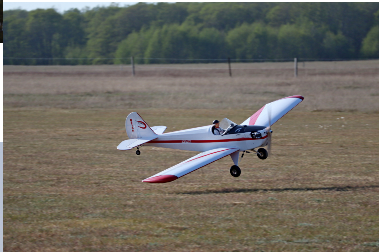
Den häftiga Ripasvängen.

Extra kul är om man kan flyga rote med någon - och Thomas nappar på utmaningen.