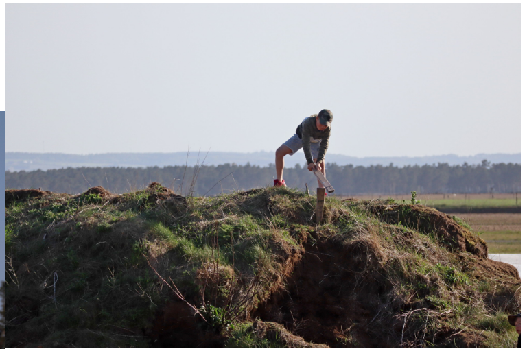
Olle har intagit "Mount Ripa"

I huvudet på en modellflygare borde kanske bildtexten vara. Per som nog rest längst till Ripa denna gången. Per flyger vanligen i Mönsterås men är välkänd på Ripa med husvagn, hustru och två modellflygande killar.