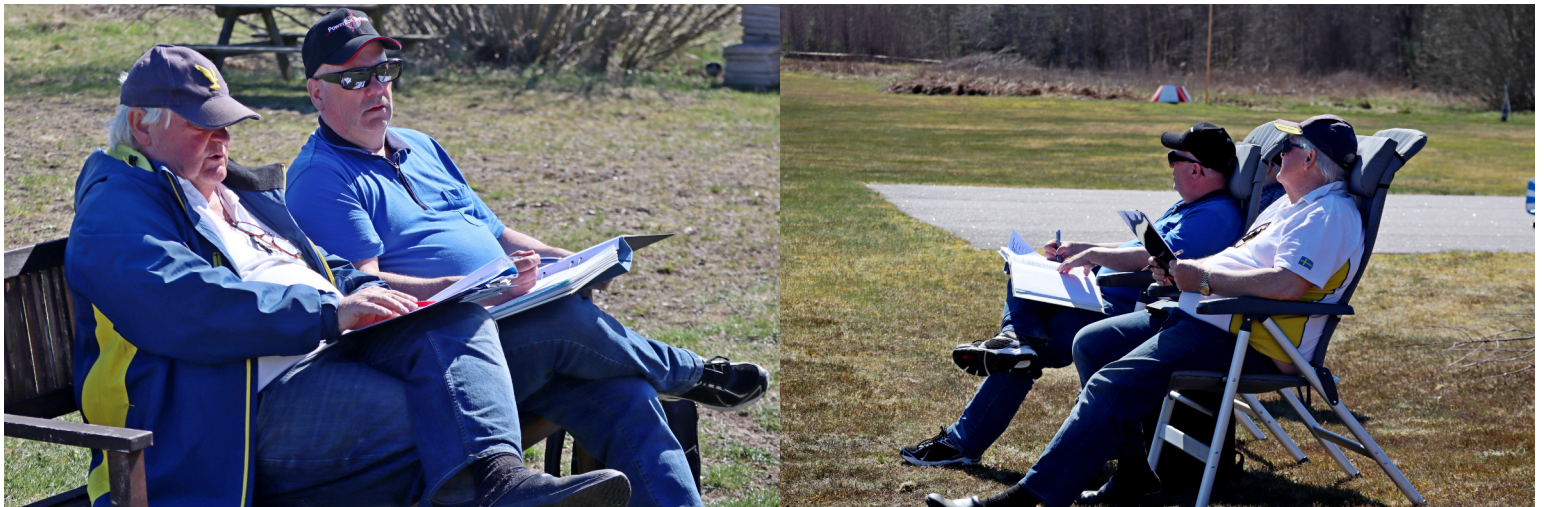
Domarna kommenterar och bedömer - nybörjare får nyttiga tips.