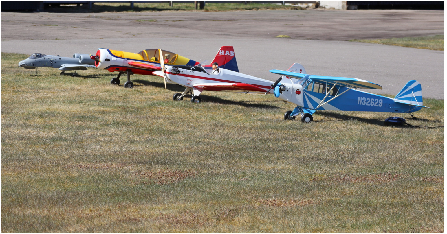
Lineup inför statisk bedömning