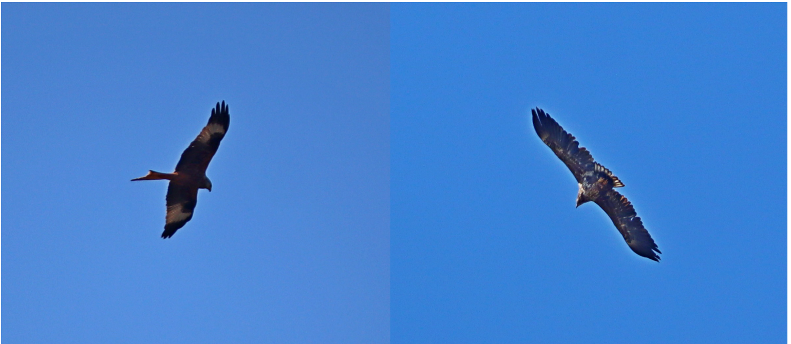
Lite publik - gladorna hälsade på hela dagen - örnen bara en gång