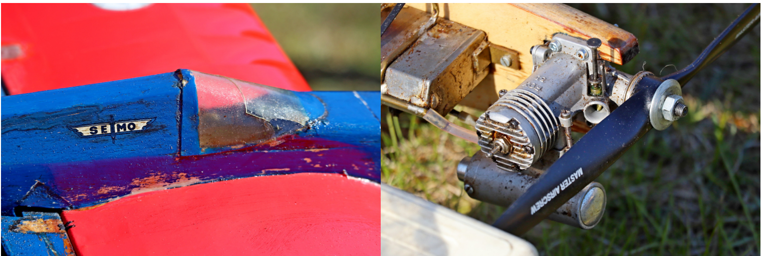
Gamla trotjänare fungerar bra i Semistuntklassen