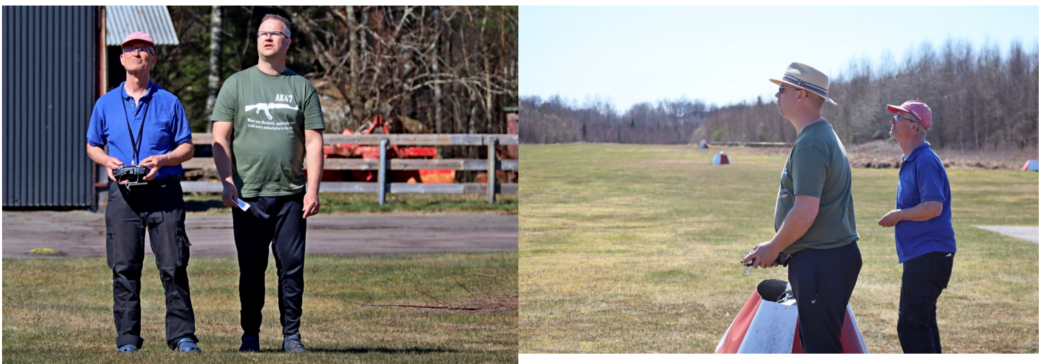
Flera bilder och filmsnutt på https://modellvanner.se/ba/2304/ Modellvänner april 2023